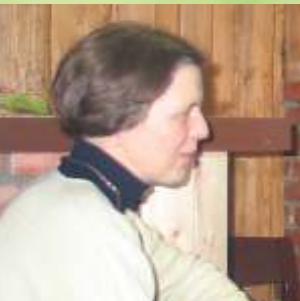
Misiukanis Biruta język litewski